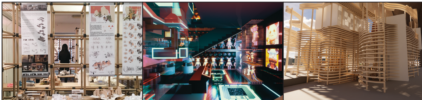
在JCCAC舉行設計作品展，主題為Housing: A New Vision

在PolyU HKCC的兩年學習生活，令我明白如何成為設計師，我亦承蒙多位良師指導，大大豐富了我的設計學知識。在PolyU HKCC畢業後，我在一家建築設計公司工作了一段時間，後來有幸重回校園，在PolyU進修。希望我在PolyU HKCC所學的知識，能夠應用在日後的學業及事業發展上。